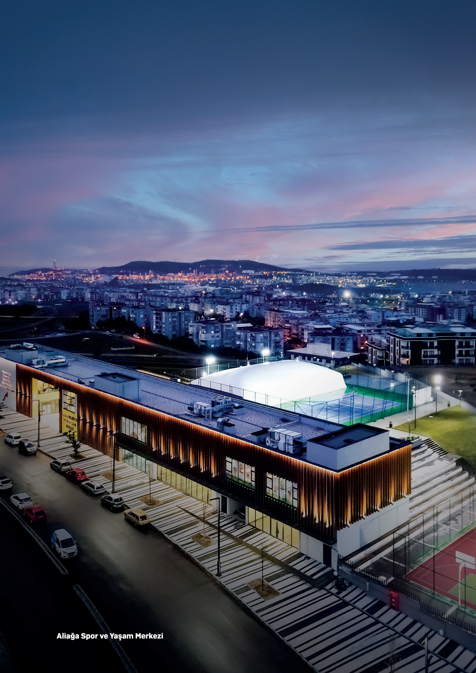
Aliğa Spor ve Yaşam Merkezi