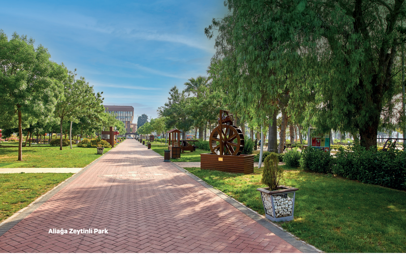
Aliğa Zeytinli Park